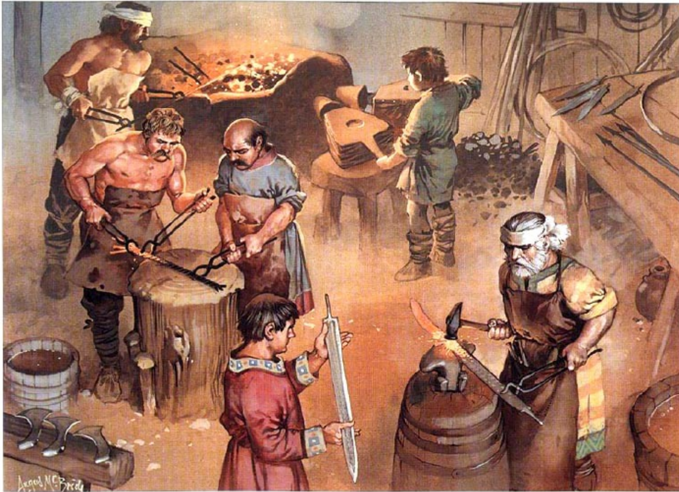
Wonders production, a Frankish workshop, 6th century