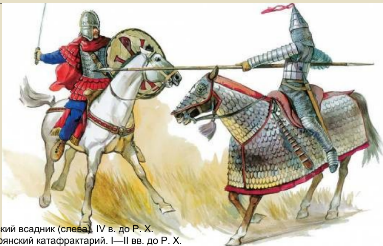
Римский всадник (слева). IV в. до Р. Х. Парфянский катафрактарий. I—II вв. до Р. Х.