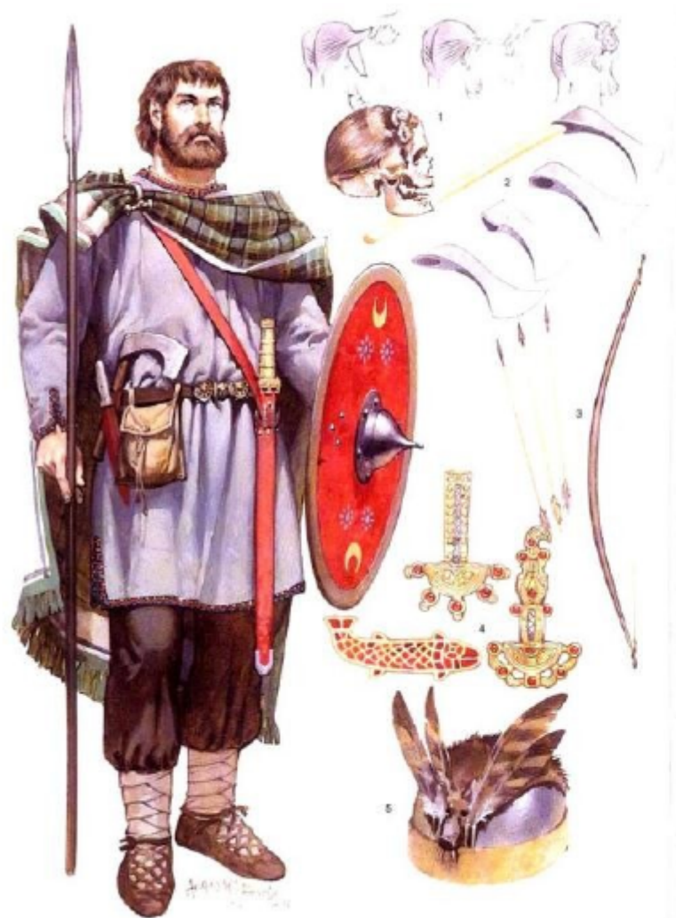
Alemannic warrior, 3rd-4th century AD (See text commentary for detailed captions)

Алеманнский воин (III-IV в.н.э.): 1 - "свевский узел" - традиционная прическа; 2 - франциска - метательный топор; 3 - германский лук; 4 - застёжки и броши; 5 - шлем с перьями.