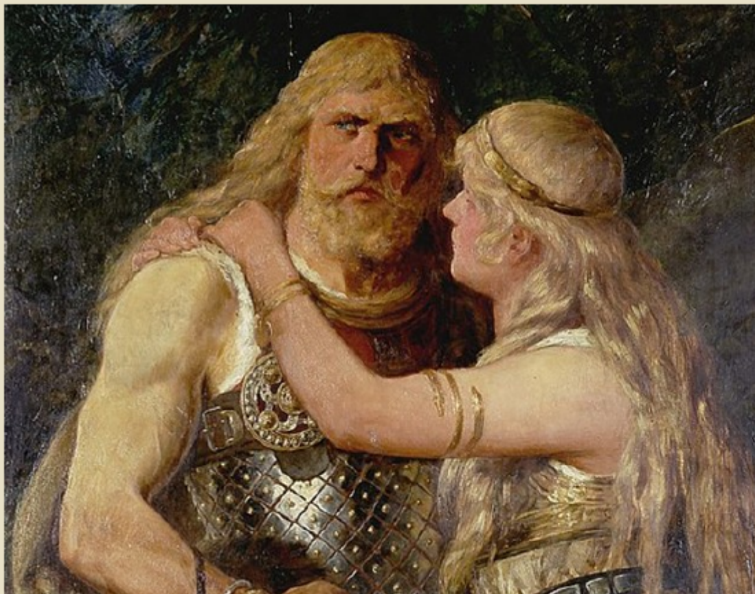
Арминий с женой Туснельдой.